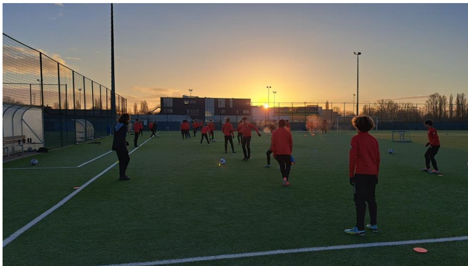
Foto: Ochtendstond heeft goud in de mond (sfeerbeeld YES-training)

Vanaf het seizoen 2021-2022 kunnen ook meisjes genieten van het YES-project. Naast de 3 avondtrainingen, kunnen zij wekelijks 2 extra trainingen overdag krijgen, afgestemd op de studies en mogelijks internaat. De overdagtrainingen liggen op maandag- en donderdagvoormiddag. Op maandag volgen de meisjes een training met de richting specialisatie sport (voornamelijk IP-spelers), op donderdag sluiten zij aan bij de YES-training. Op die manier krijgen zij een op maat aanbod, met een juiste balans tussen succesbeleving en uitdaging. We zijn verheugd dat vele meisjes volgend seizoen nieuw instromen en zijn ervan overtuigd dat dit project ook voor hen even succesvol wordt als dit voor de jongens de afgelopen jaren gebleken is.