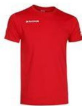
Katoenen T-shirt (opwarming wedstrijd)