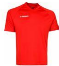
Synthetisch T-shirt (Training)